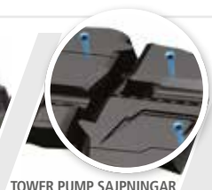
TOWER PUMP SAJPNINGAR